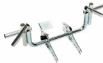
Πτυσσόμενος βραχίονας συγκράτησης αμαξιδίου Αντί του τυπικού βραχίονα Art. no. 975 100