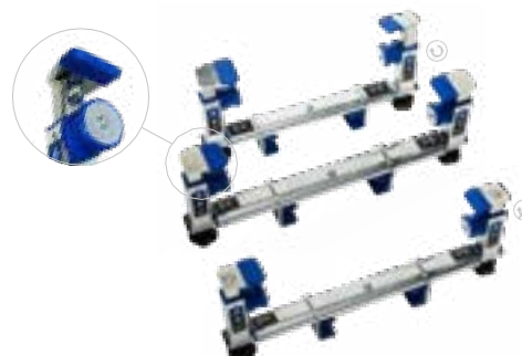
Σφιγκτήρας πλάτης - ρυθμιζόμενο Standard (εύρος σύσφιξης: 360 mm - 500 mm) Art. no. 975 146

Πλατύ (εύρος σύσφιξης: 460 mm - 600 mm) Art. no. 975 149