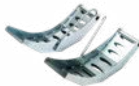
Μικρές ράμπες πλάτος τροχιάς έως 710mm Art. no. 975 143 πλάτος τροχιάς έως 740 mm Art. no. 975 165