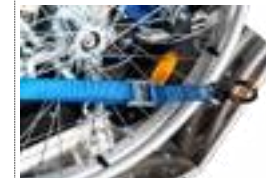
Σύστημα ζώνης για κίνηση σε ράμπα Art. no. 975 140