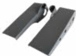
Πρόσθετες ράμπες ειδικά για μεταφορά αμαξιδίων Art. no. 975 103