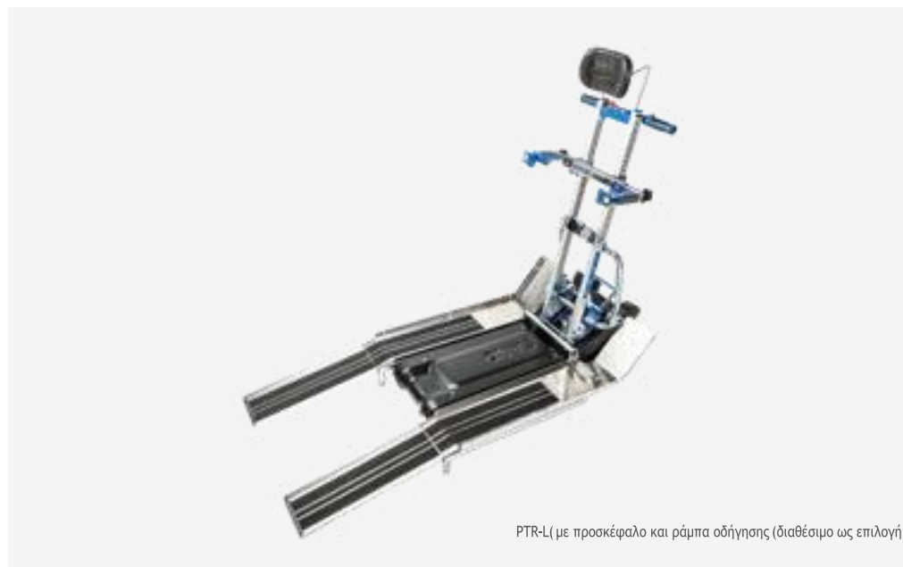
PTR-L ( με προσκέφαλο και ράμπα οδήγησης (διαθέσιμο ως επιλογή )