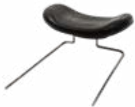
Προσκέφαλο Art. no. 075 104