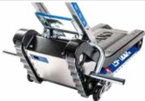
Γκρι μέρη, τοποθετημένα για LIFTKAR PTR, Art. no. 075 087 για LIFTKAR PTR-L, Art. no. 076043