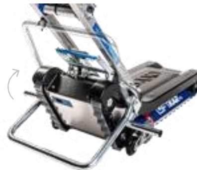
Σύστημα κλίσης Art. no. 975 115