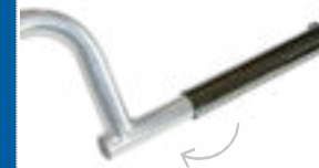
Επέκταση Βραχίονας συγκράτησης αμαξιδίου +100 mm Art. no. 975 105