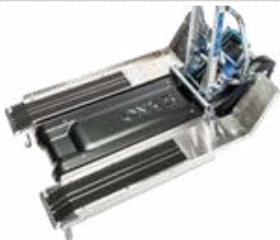
Ράμπες οδήγησης ιδανικό για LIFTKAR PTR-L Art. no. 975 110