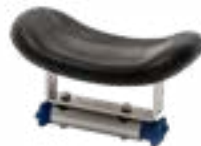
Προσκέφαλο ρυθμιζόμενο Art. no. 975 141