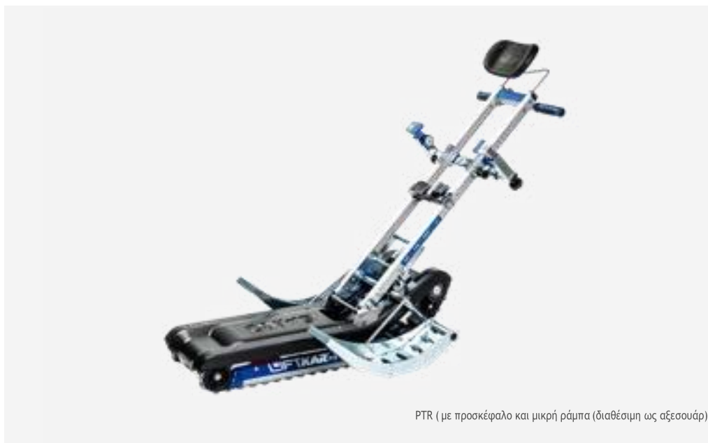
PTR ( με προσκέφαλο και μικρή ράμπα (διαθέσιμη ως αξεσουάρ)